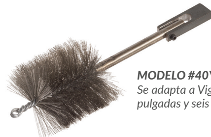
MODELO #40Y Se adapta a Viga I a cuatro pulgadas y seis pulgadas

Consulte nuestro sitio web para obtener información sobre Los Limpiadores Motorizados , así como otros equipos de Mighty Lube.